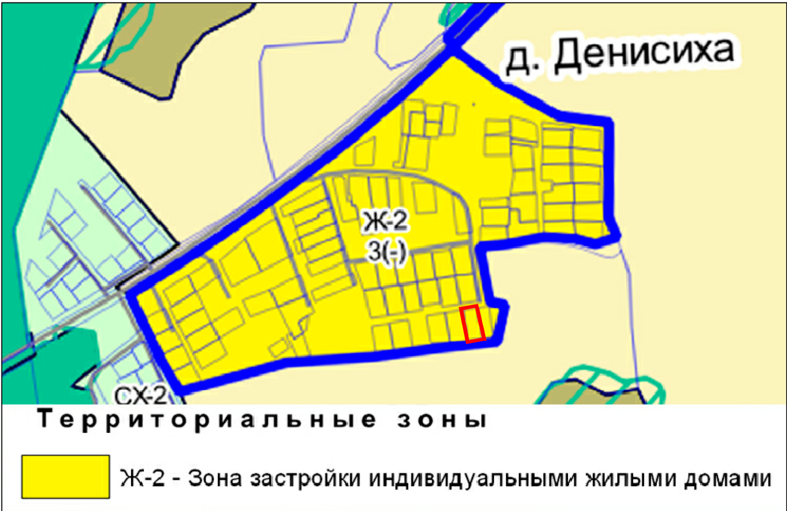
фрагмент карты территориального планирования