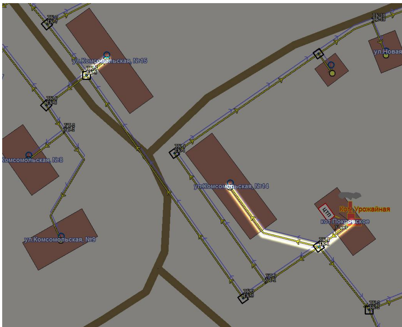
Рисунок 7.2 - Участки тепловой сети котельной с. Покровское, ЖКХ, ул. Урожайная, д.8 с завышенными удельными сопротивлениями