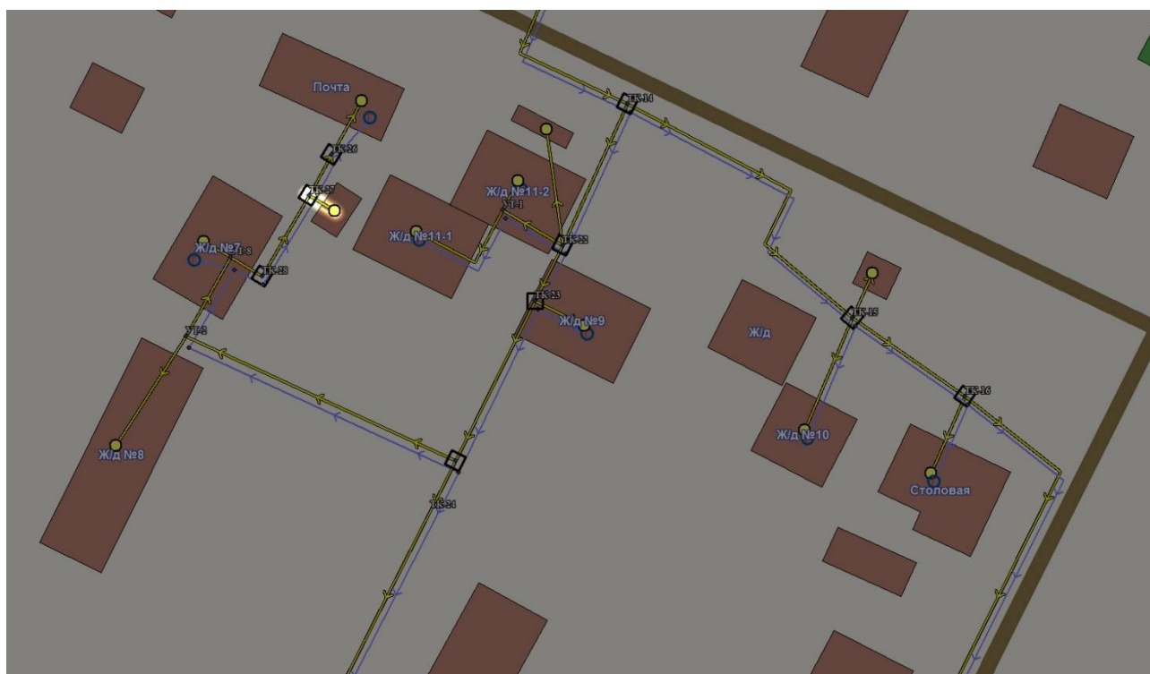
Рисунок 7.1 - Участки тепловой сети котельной д. Нововолково, д.22 с завышенными удельными сопротивлениями

На рисунках 7.1 - 7.5 указаны участки тепловых сетей котельных Волковского сельского поселения с завышенными удельными линейными потерями напора.