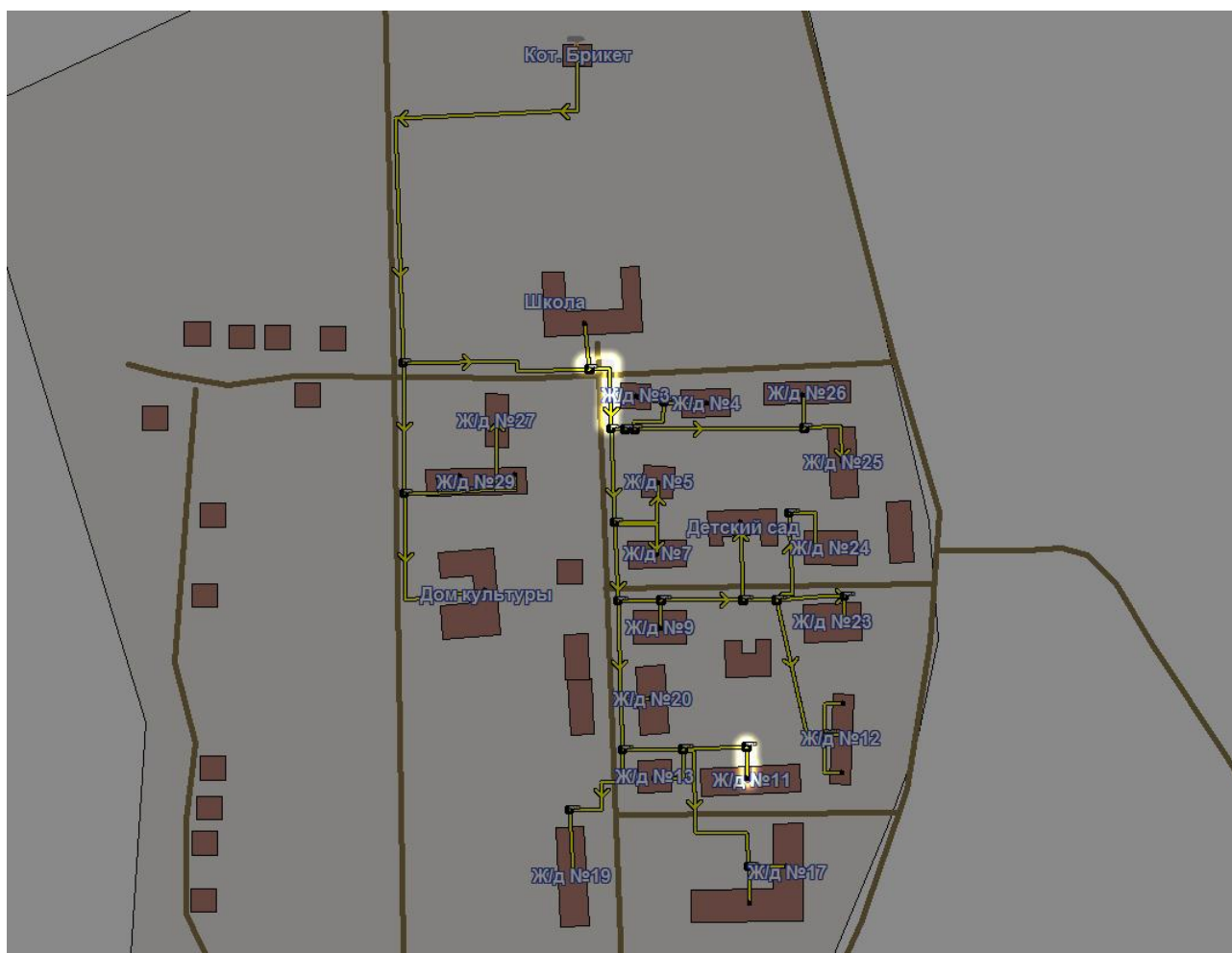
Рисунок 7.5 - Участки тепловой сети котельной п. Брикет, д.88 с завышенными удельными сопротивлениями