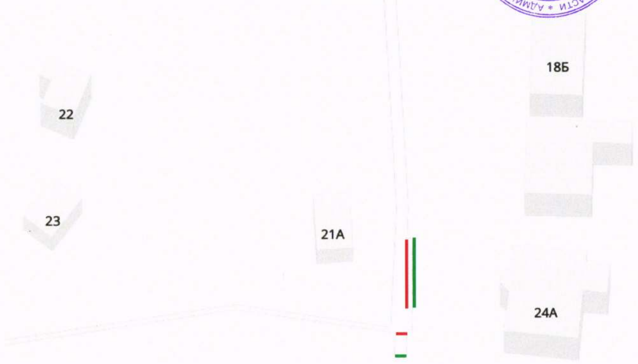
Схема места переноса бетонных ограждений на проезжей части вблизи домов №21А и №24А деревни Артюхино на землях общего пользования

Приложение к Постановлению Главы Рузского городского округа от 29.10.2018 № 4022