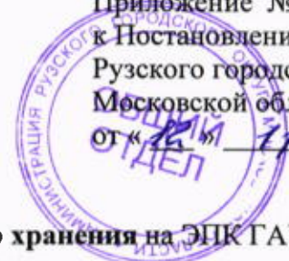
График представления на утверждение описей дел постоянного хранения на ЭПК ГАУ и комплектования архива в 2020 году