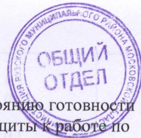
ТАБЛИЦА оценочной ведомости по содержанию и состоянию готовности пунктов выдачи средств индивидуальной защиты к работе по предназначению