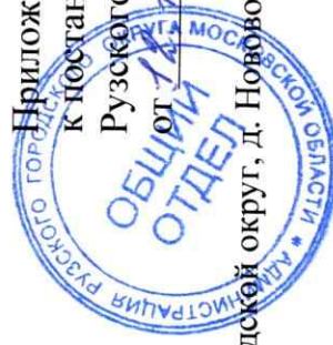
Схема расположения дороги, расположенной по адресу: Московская область, Рузский городской округ, д. Нововолково, Сельскохозяйственный проезд