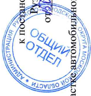
Схема ограничения движения в период с 01 по 30 июня 2022 года на участке автомобильной дороги г. Руза, ул. Социалистическая

Приложение к постановлению Администрации Рузского городского округа от 15.06.2022 № 241/19