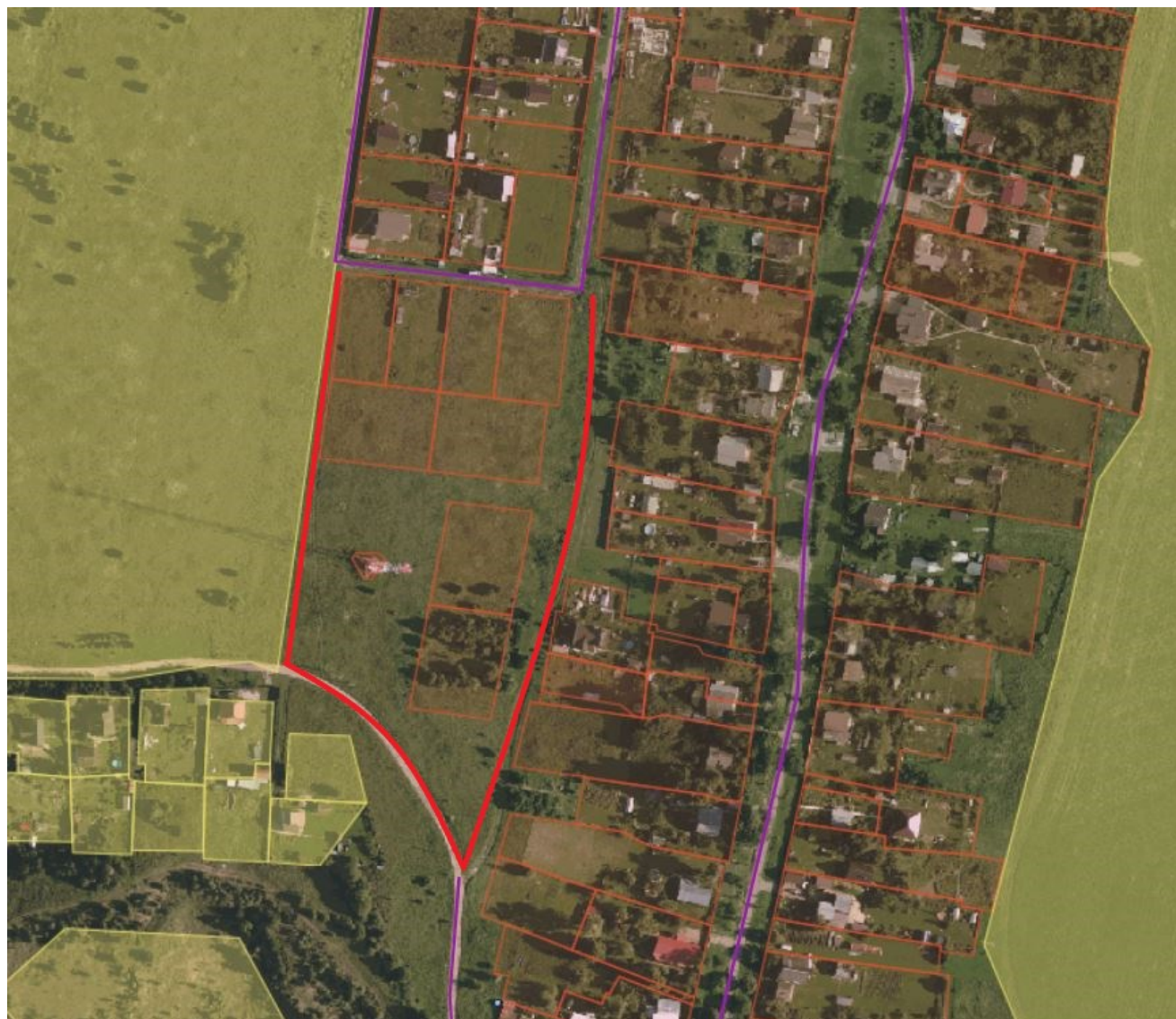
Схема расположения автомобильной дороги, расположенной по адресу: Московская область, Рузский муниципальный округ, д. Коковино, к домам 27В,29,31,33

Приложение №2 к постановлению Администрации Рузского муниципального округа от 03.03.2026 № 488-ПА