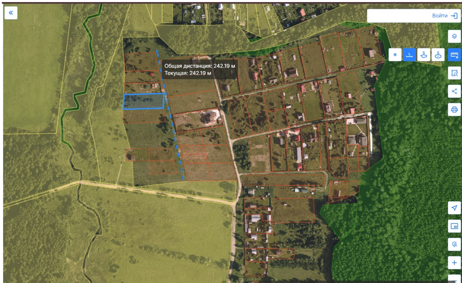
Схема расположения автомобильной дороги, расположенной по адресу: Московская область, Рузский муниципальный округ, д. Староникольское, ориентир земельный участок 50:19:0060206:601