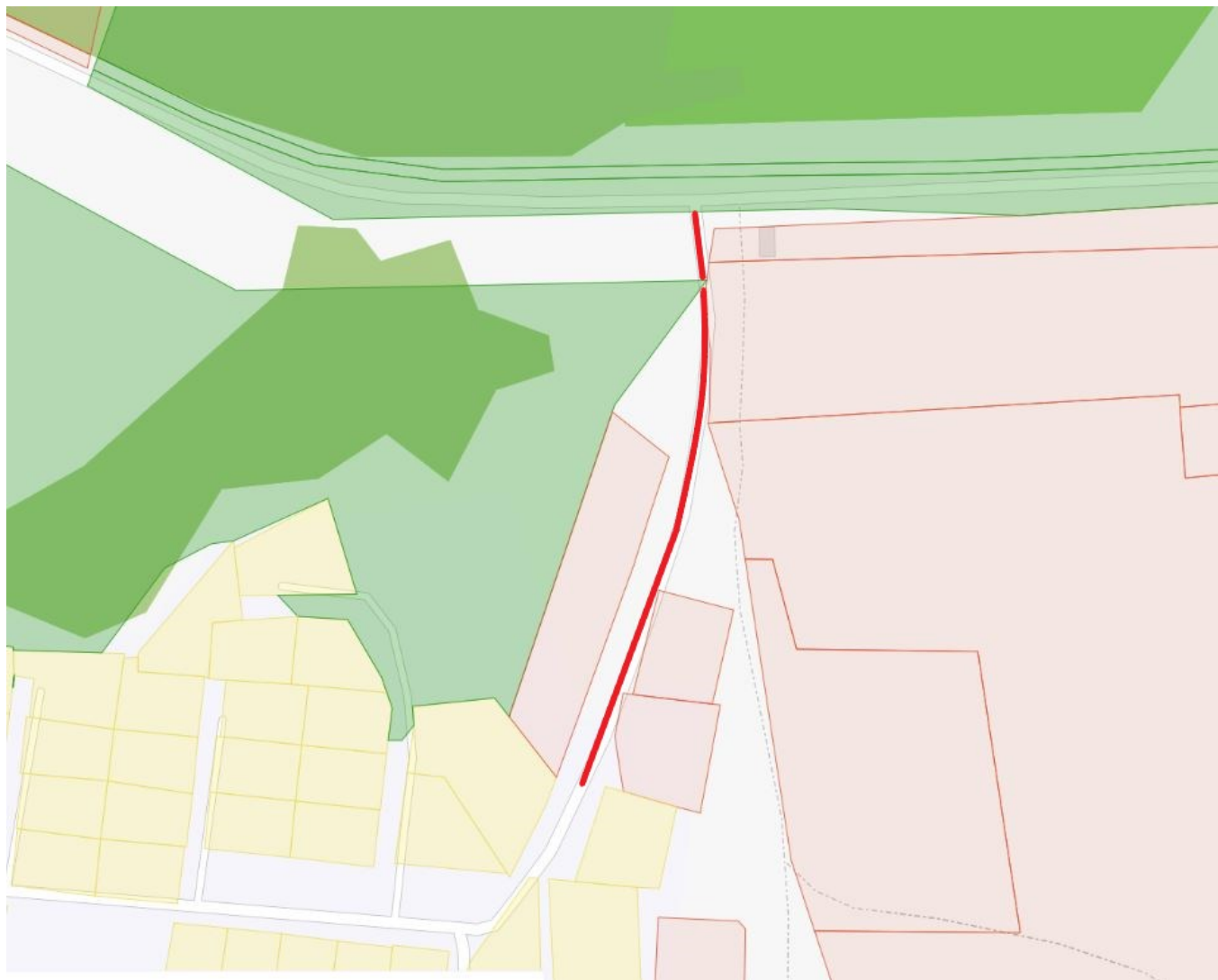
Схема расположения автомобильной дороги, расположенной по адресу: Московская область, Рузский муниципальный округ, от Технологического проезда к садовому товариществу Художник-График-2