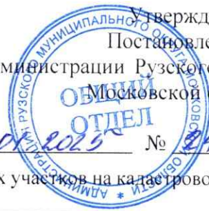
Схема расположения земельного участка или земельных участков на кадастровом плане территории.