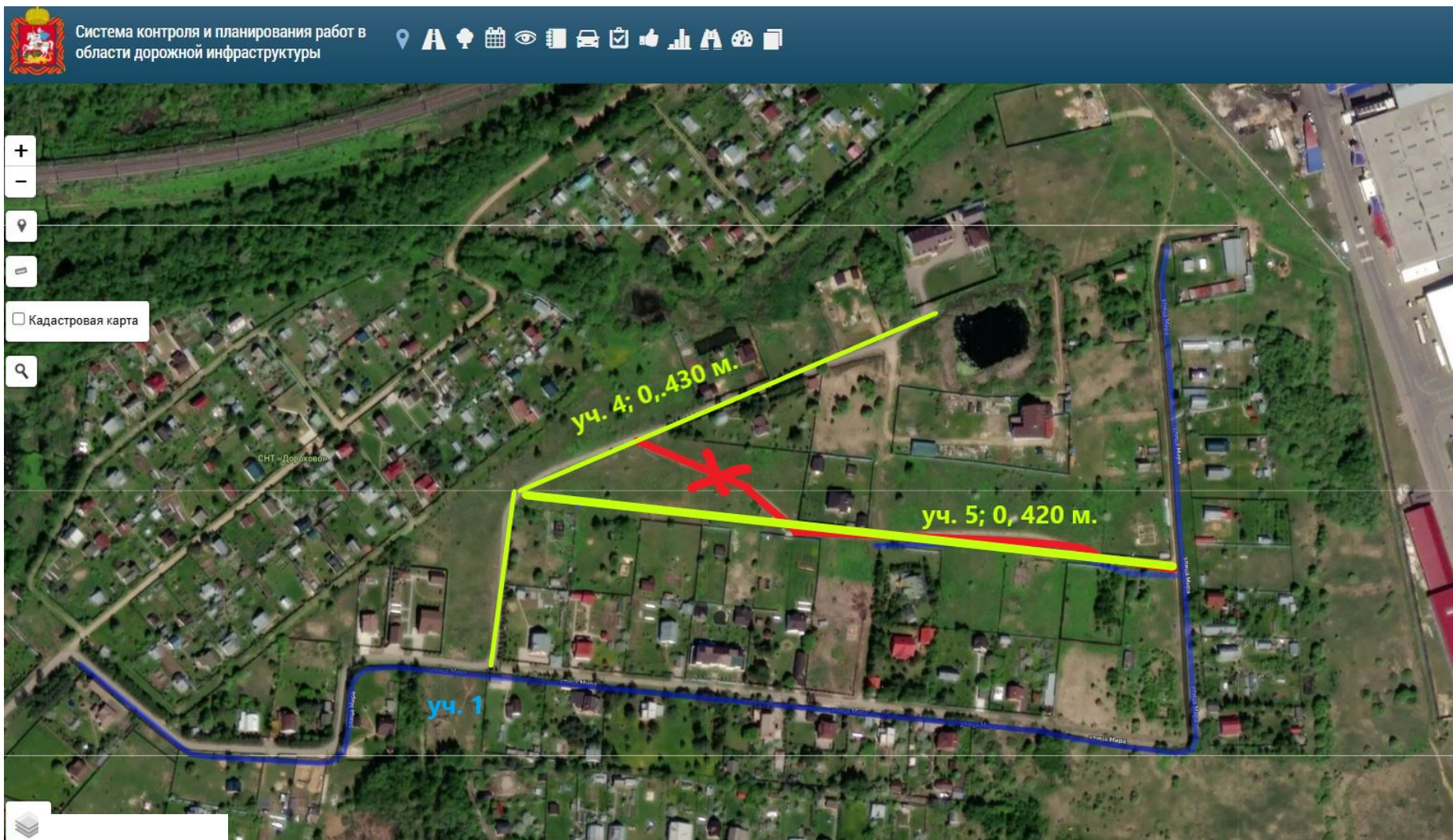
Схема расположения автомобильной дороги, расположенной по адресу: Московская область, Рузский муниципальный округ, д. Шелковка, участки №№ 4, 5